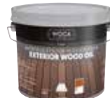
OIL-WOCA-011 Woca Exterioröl (Teak- Farbe) 2,5 Liter