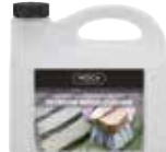
CLEANER-WOCA-01 Woca Terrassenreiniger 2,5 Liter